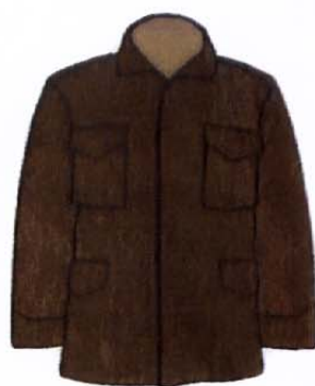
جلوی آور کت