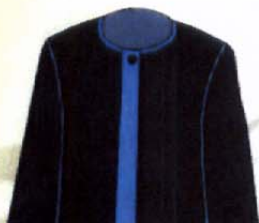
جلوی مانتو تابستانه