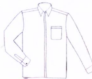
جلوی پیراهن تابستانی