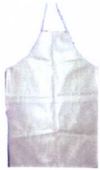
پیش بند تا قوزک پا